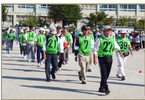
昨年の市民大運動会の入場式

今出場する選手を募集しています。混合リレー、ゲートゴルフリレー、リレーボール、ムカデ競走など7種の対抗競技、グルメ競走、親子でジョイショなど4種の一般競技などの競技種目があります。申し込み締め切りは9月14日(日)です。奮って参加ください。