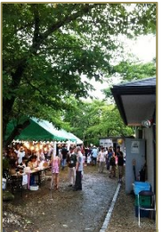
雨天で短縮した昨年の夏まつり

夏まつりでは、近隣の皆さんと協力して親睦を深めていただき、月涼し夏のひと時をお楽しみください。