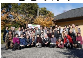
なばなの里での記念写真

今年も隔年で行われる「バスで行く高台帰りのツアー」が行われる予定です。これまで「舞鶴」「伊勢」「若狭」などに旅行し、前回は「長門温泉」で、なばなの里や温泉を楽しみました。 今スポレク部会で、秋の実施に向け、検討が進んでいます。おいしいものを食べ、一日のんびりと親交を深められる旅行先を考えていきます。