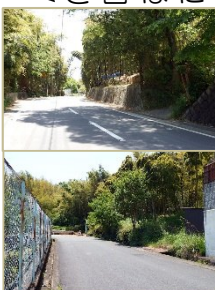
上:バス通りからの出入口予定地 下:4丁目からの出入口予定地

田明寺鳥居前宅地造成工事が、今年9月より予定されています。場所は高台4丁目の南から田明寺団地にかけての南谷とよはれる地域です。一戸建て宅地全125区画の計画です。