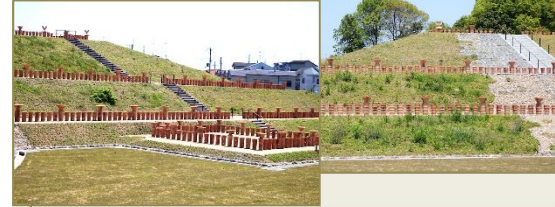
左:恵解山古墳西側から見る 右:同南から見る

「恵解山古墳」(いげのやまこふん)は、阪急西山天王山駅の東300mにある乙訓地区最大の古墳です。古墳時代中期1600年前に造られた全長180mのこの古墳からは、昭和55年の発掘で鉄製直刀や鉄剣など200本を超える武器が出土しています。これだけ多くの鉄製武器の発見は、京都府内では初めてであり、全国的にもほとんど例を見ないものです。そのためこの古墳は乙訓地区を支配した有力な豪族の墓と考えられています。また古墳が造られた後の西暦518年に、高槻の今城塚古墳に葬られた古代最大の謎の天皇継体天皇が弟国宮(おとくにのみや)に遷都しています。そのため恵解山古墳に葬られた一族と継体天皇は関係があるともいわれます。恵解山古墳は、今史跡公園としての工事が進められています。竹藪であった丘陵は整備され往時の墓石に戻され、周辺には多くの円筒埴輪などが並べられています。オープンは今10月ですが、その威容は近くから見る事ができます。